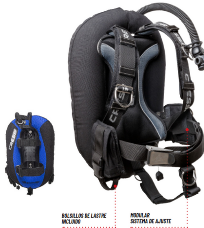
AQUA WING PLUS / IC790100