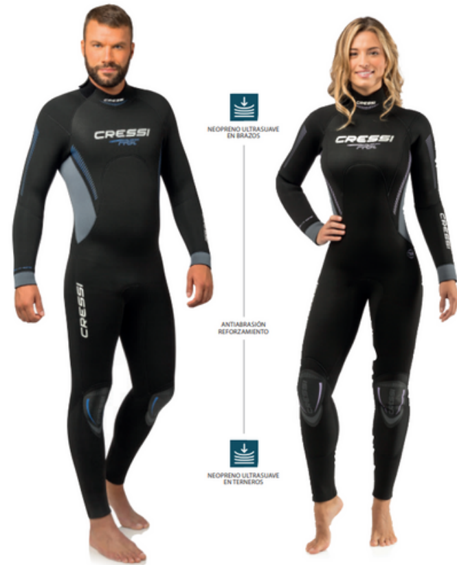
FAST 7MM / LR108703