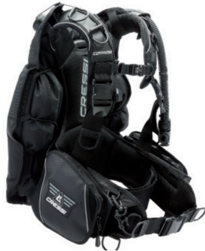
COMMANDER EVOLUTION / IC771002