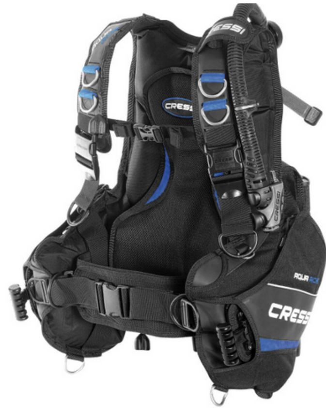
AQUARIDE / IC740802