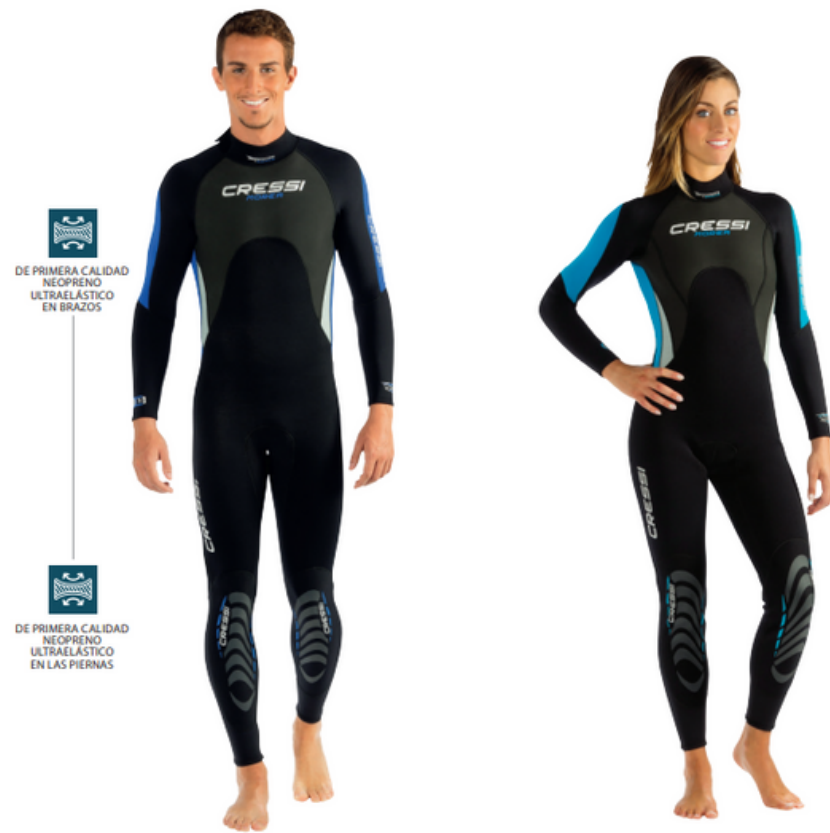
MOREA 3MM / LU476003